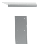
Riser superiore e laterale