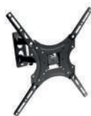
Staffa a muro orientabile