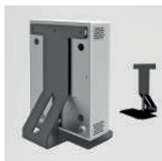
Supporto da tavolo